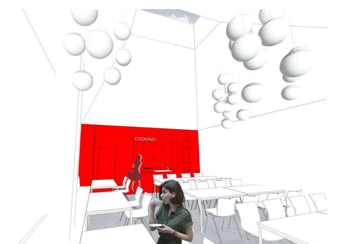
Perspektive Mensa © ROBERT MAIER ARCHITEKTEN