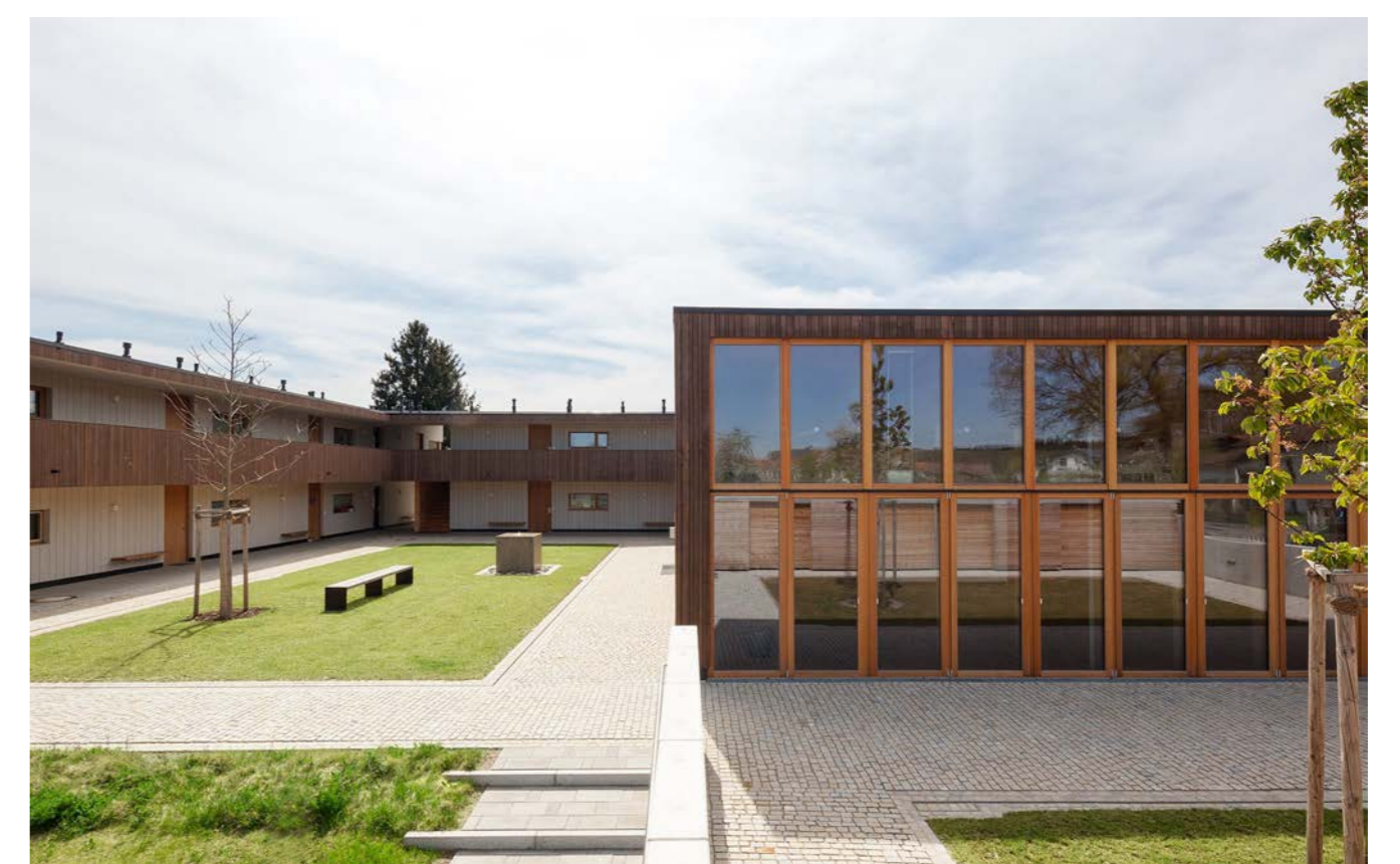
Innenhof mit Gemeinschaftshaus