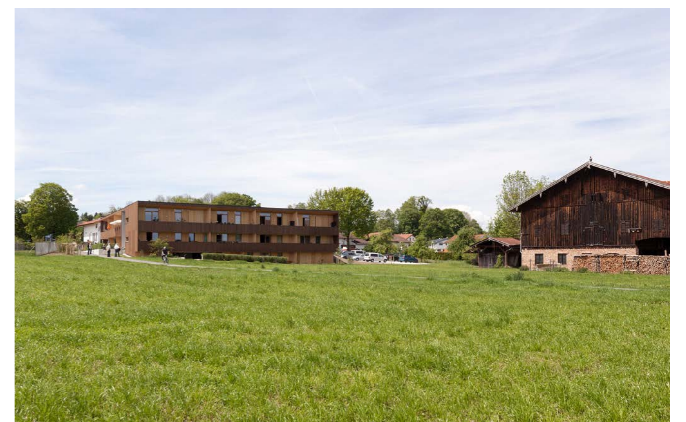
Ländliche Typologie © Marius Ballasus

Nach dem Motto - "Alt werden und gemeinsam jung bleiben!" entwickelte Schechen zum demografischen Wandel und den veränderten Lebensstrukturen ein neues Konzept für Wohnen und Nachbarschaft in der Gemeinde. Die dafür gegründete Modest Mitterhuber Stiftung setzte sich zum Ziel, eine Wohnanlage für altengerechtes und betreutes Wohnen zu errichten und zu betreiben. Das Projekt mit 16 Wohnungen ist das erste im Rahmen des Kommunalen Wohnraumförderprogramms der Regierung von Oberbayern realisierte Bauwerk. Die winkelförmige Wohnanlage aus Holz orientiert sich in seiner Grundform an den landwirtschaftlichen Gebäuden der Umgebung. Mit dem Gemeinschaftshaus fasst das klare Ensemble einen zentralen ebenerdigen Hof. Von hier werden alle Wohnungen über Laubengänge witterungsgeschützt und barrierefrei erschlossen. Diese laden zur Begegnung und zur Kommunikation von Bewohnern und Besuchern ein. Die Pultdächer öffnen sich zur Landschaft und ermöglichen bei guter Witterung einen grandiosen Ausblick in die Berge. Privatgärten und Gemeinschaftsgärten bieten gleichermaßen Raum für Rückzug und Geselligkeit. Im Gemeinschaftshaus können private Feiern der Senioren oder auch öffentliche Veranstaltungen der Gemeinde durchgeführt werden. Die einzelnen Wohnungen erhalten durch die sichtbare auskragende Geschossdecke aus Brettspertholz größtmögliche räumliche Flexibilität. Ein umweltfreundliches Blockheizkraftwerk versorgt das Haus sowie weitere umliegende Gebäude nachhaltig mit Strom und Wärme.