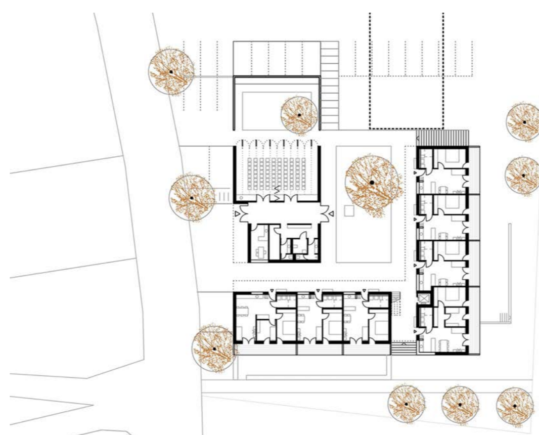
Grundriss Erdgeschoss © Deppisch Architekten