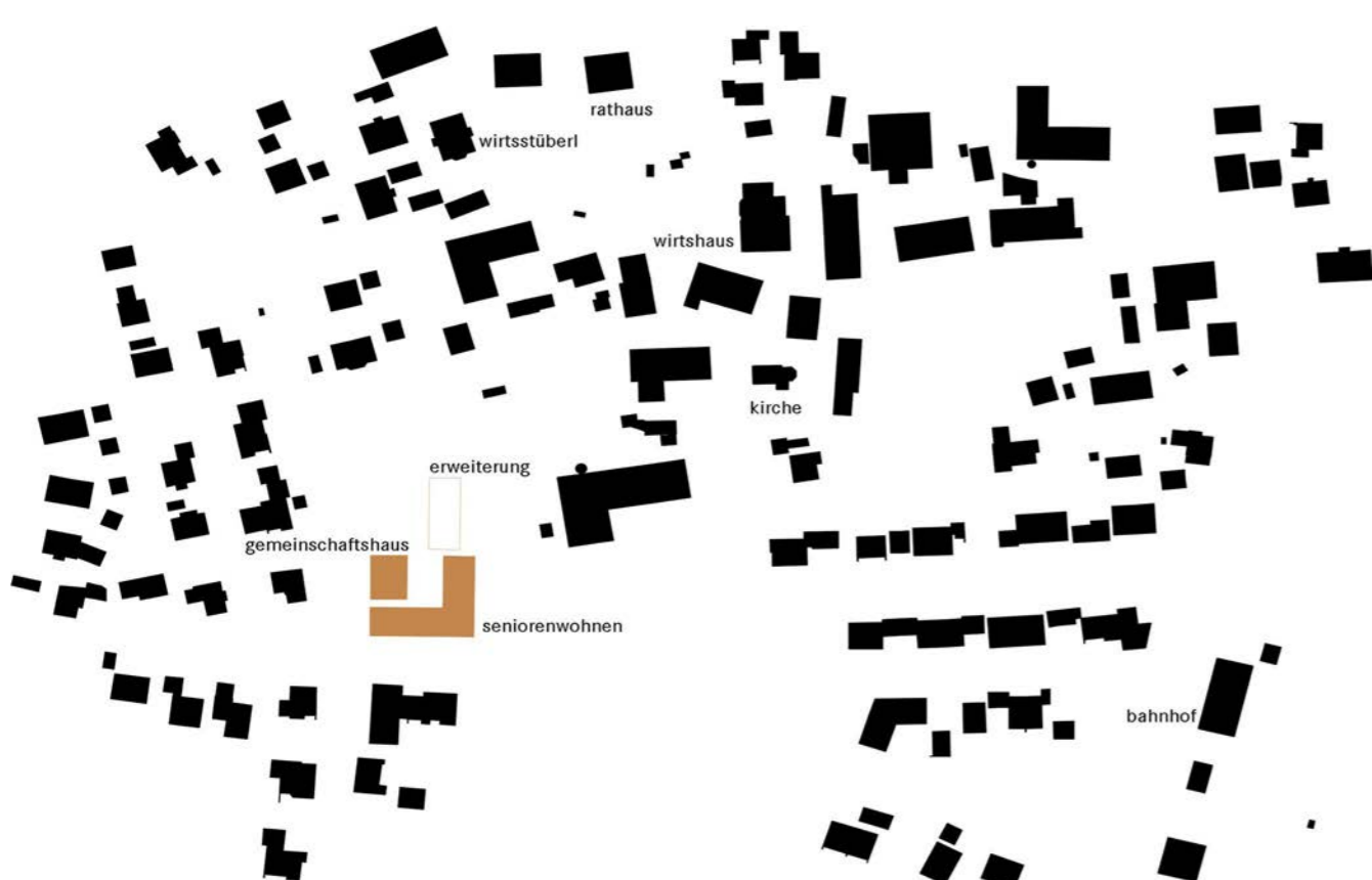
Lageplan © Deppisch Architekten