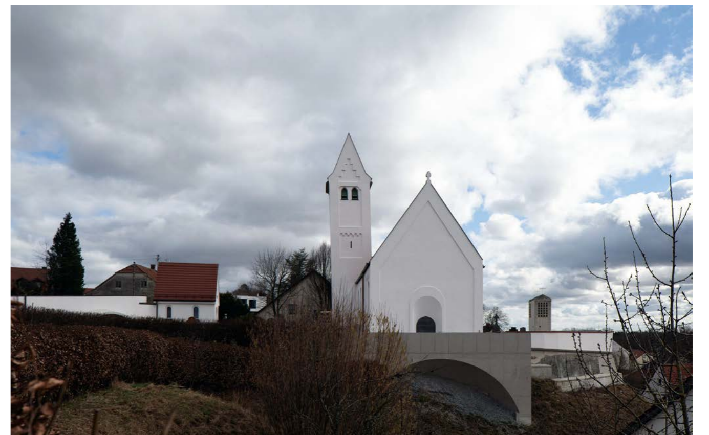
Kirche Aufbahrung/Aussegnung Eingangsplateau

Die neuen Kirchenfenster des Münchner Künstlers Prof. Jerry Zeniuk tauchen das Innere in buntes Licht; vor allem bei Sonnenschein wandern Farbflächen im Tagesverlauf über die Wände, die in neutralen Tönen gehalten sind.