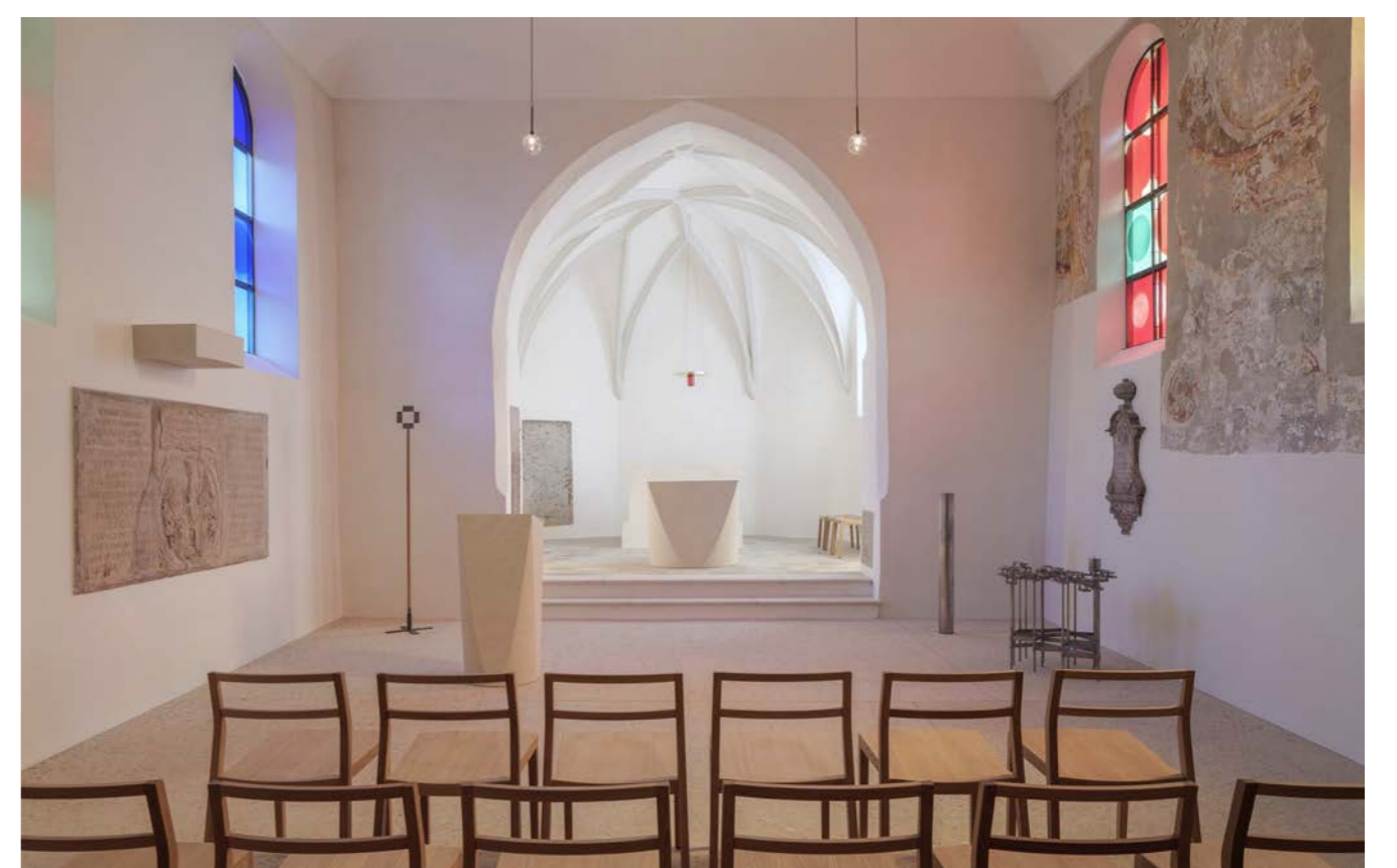
Kirche Innenraum