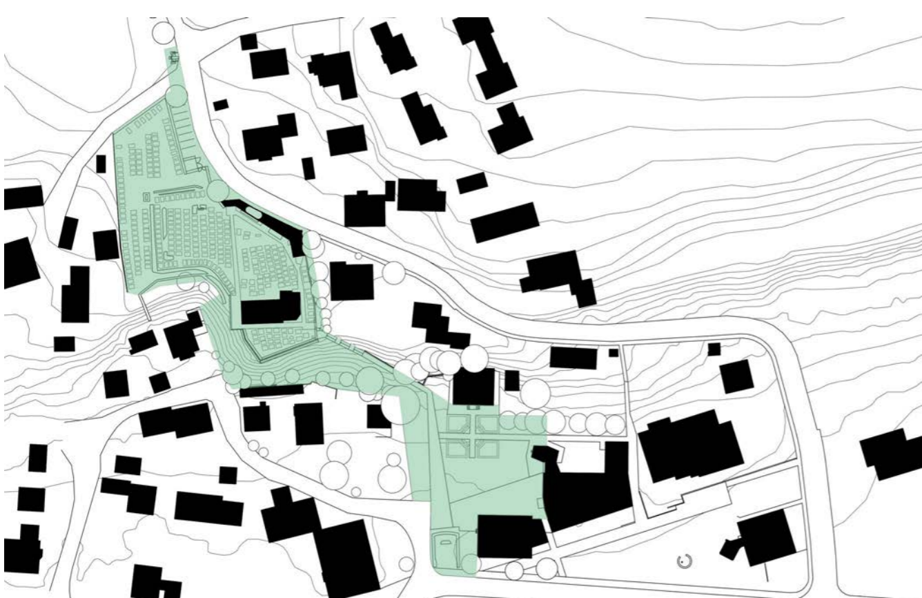
Lageplan © Heim Kuntscher Architekten