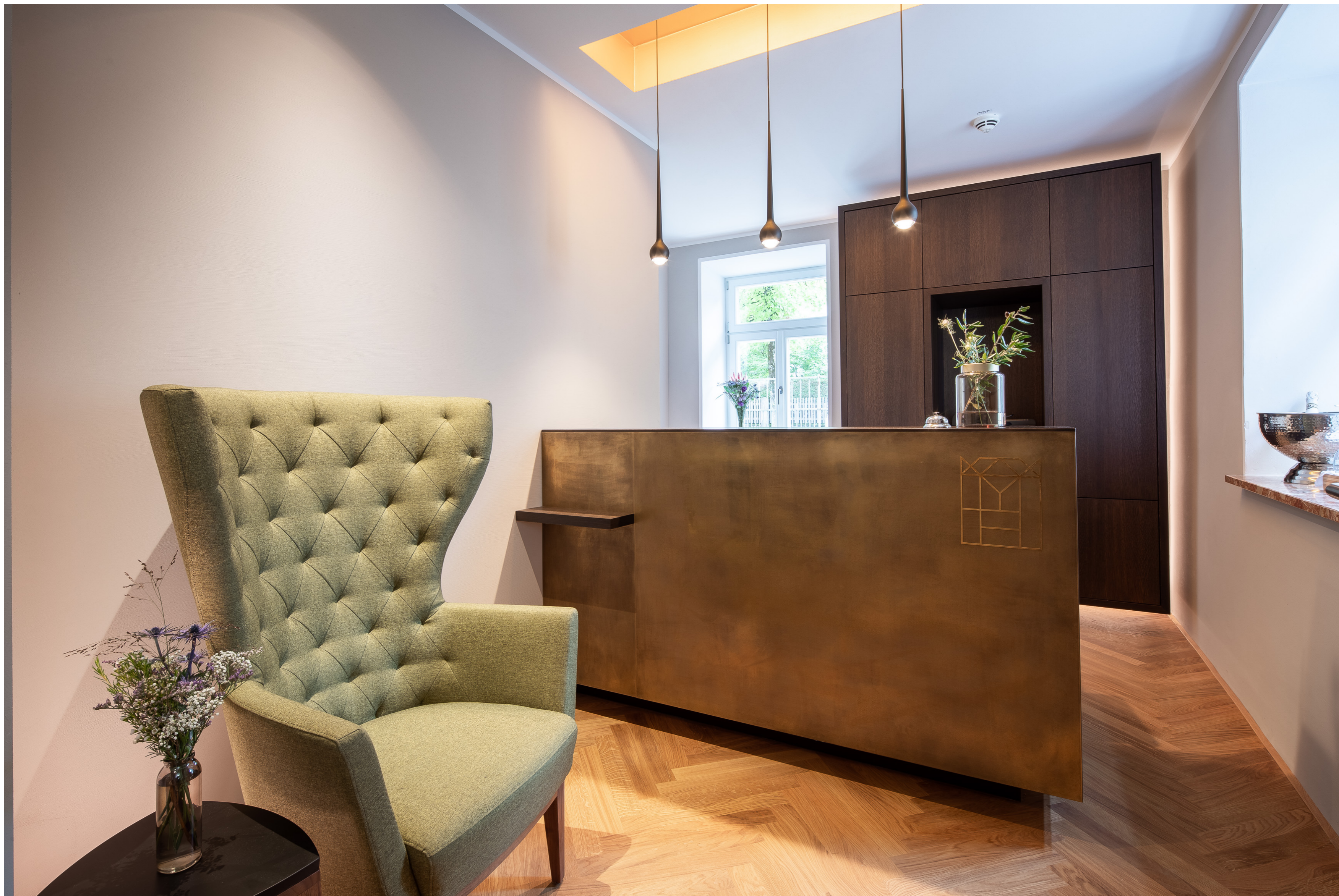
Eingangsbereich Rezeption Villa Rein